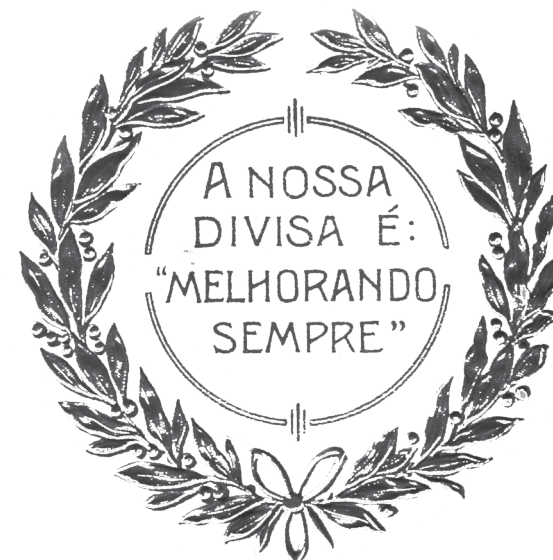
Divisa da Fábrica Brandão, Gomes & C. a