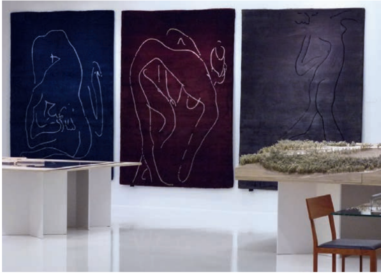
Álvaro Siza Collection I (Women 4, Women 3, Women 2).