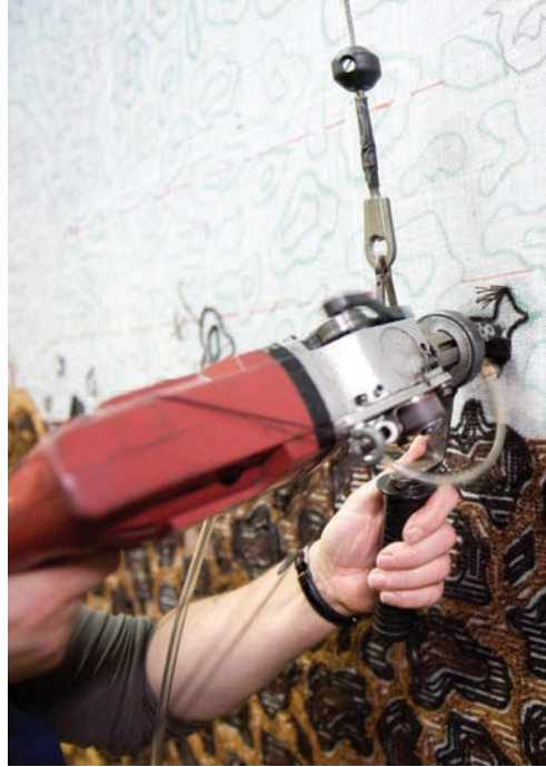
Hand-Tufting (Tufado Manual).