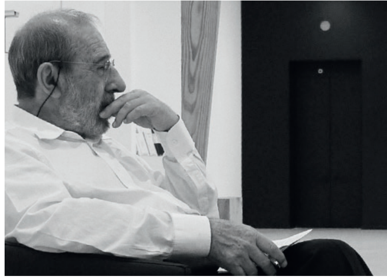
Álvaro Siza Vieira.

Due to the constant growth of the business, the company has adopted a new human resources policy, by hiring highly qualified people who speak fluently multiple languages and are extremely comfortable working with all the markets where the company is present.