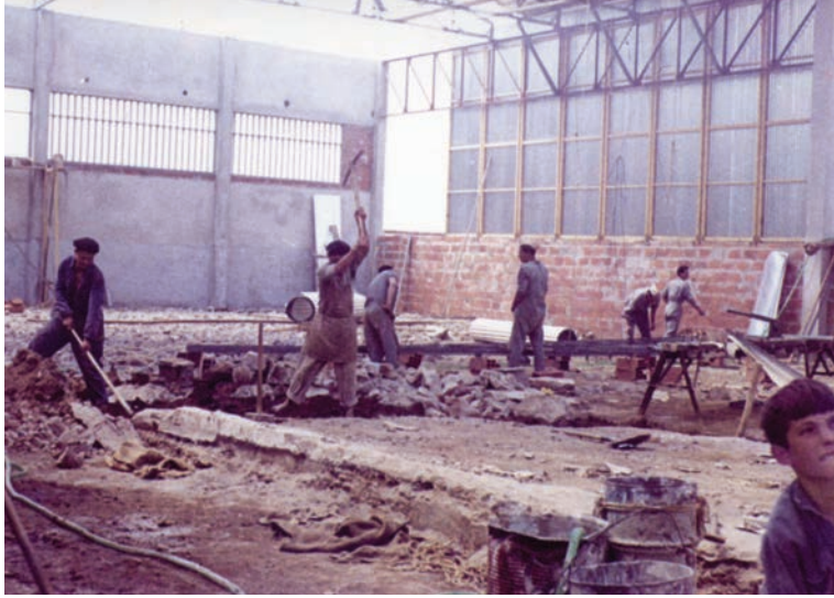
Obras de ampliação da unidade fabril, início da década de 1970.