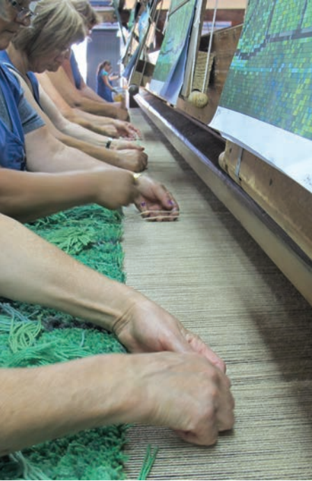
Hand-Knotting (Nó Manual).

Among others, the company is currently working on a project for the Winter Olympic Games of 2014, in Sochi, Russia.