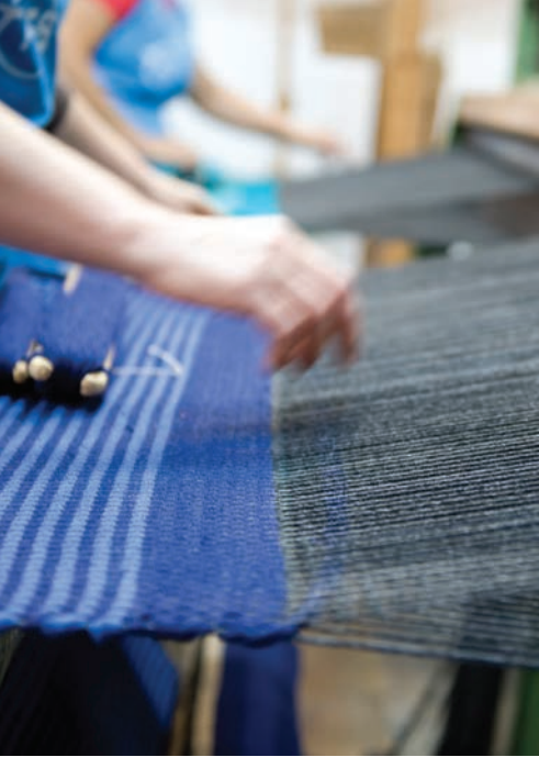
Hand-Weaving (Tecelagem Manual).